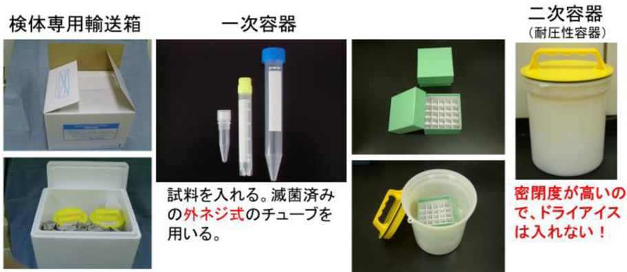
図3 サル類の検体輸送、取り扱い上のバイオリスク管理

試験検査部の P2 実験室内には、安全キャビネット、オートクレーブなどバイオセーフティ管理上必須となる機器が設置されている。検査材料は実験室内で取り出され、室内の安全キャビネット内で取り扱われる。また、検体を取り扱う検査職員は個人防護具（personal protective equipment: PPE）を身に付け、病原体の暴露に備えている（図4）。