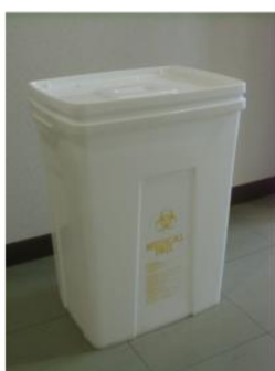
廃棄物回収用ペール缶

医学研究用サル類の検査の実際と検体を取り扱う上でのバイオリスク管理について述べた。一般社団法人予防衛生協会は40年以上にわたりサル類を専門に扱ってきた。ウイルス、細菌、寄生虫や原虫類について、サル特有の病原体が存在し、中にはヒトに感染した場合、重篤化するものも含まれている。最近、B ウイルス感染患者の発生が、厚生労働省より公表された。サルの飼育現場はもちろん、検体を取り扱う検査室でも取り扱いには十分注意しなくてはならない。今一度、現場の環境を見直し、バイオ